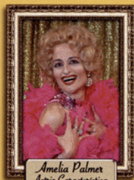
Amelia Palmer Actriz Característica