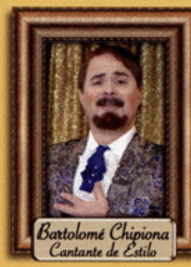
Bartolomé Chipiona Cantante de Estilo