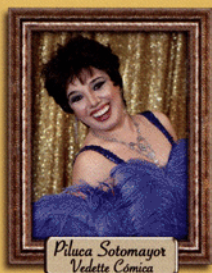
Piliuca Sotomayor Vedette Cómica