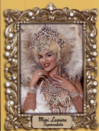
Mimi Lupiere Supervedette