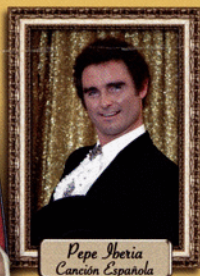
Pepe Iberia Canción Española