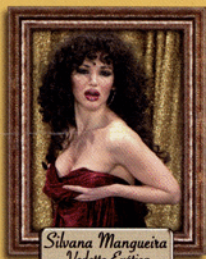
Silvana Mangueira Vedette Exótica